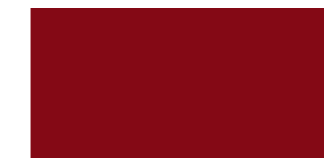
8019 Kırmızı / Red